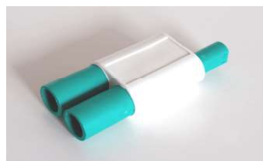
MiniConnect T splitter